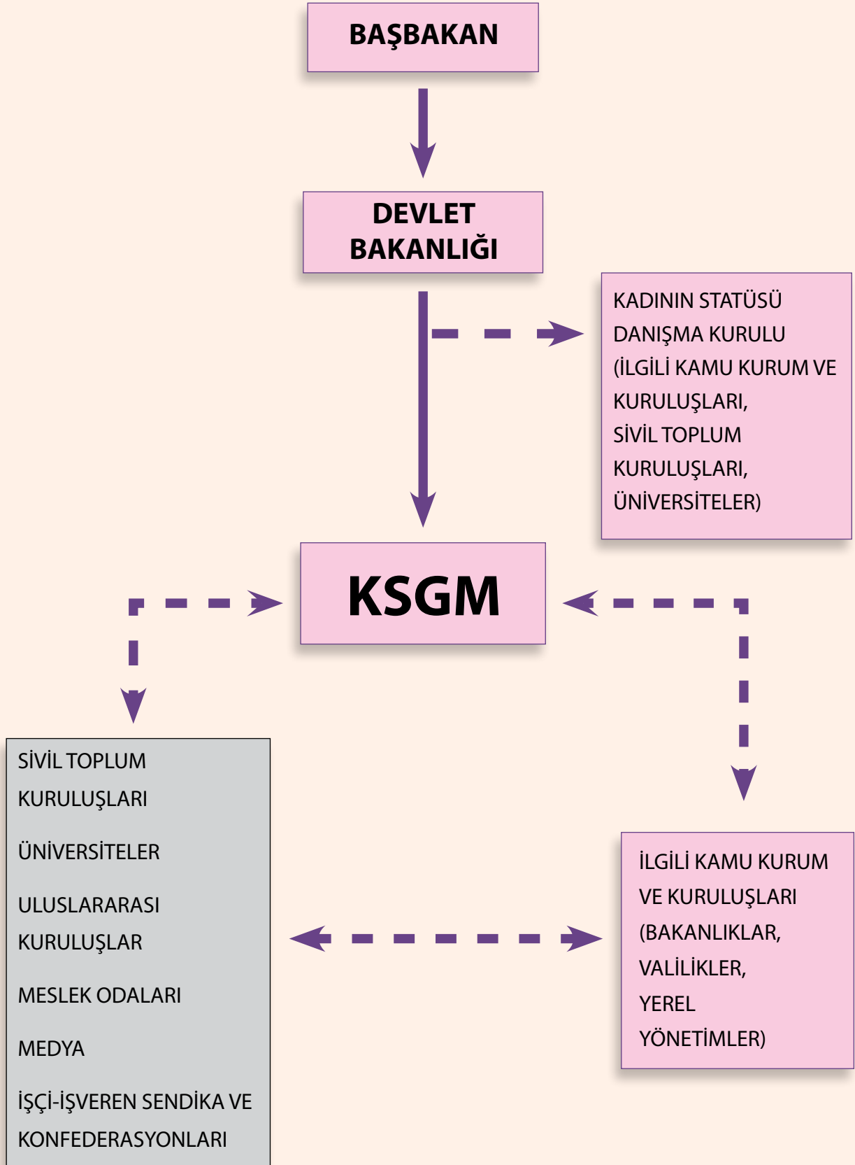
Şema 2.1 Türkiye’de Kadın Politikalarının Geliştirilmesi ve Uygulanmasına İlişkin Yapı